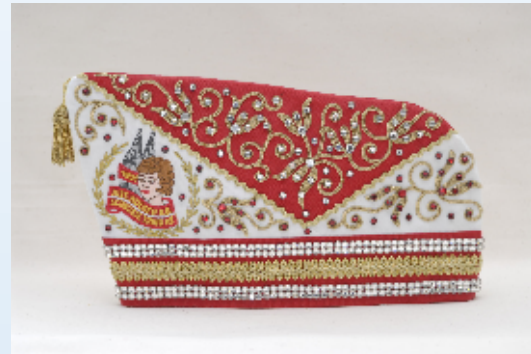
Wappen und Steine