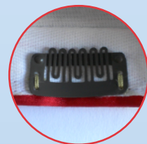
Spezial - Clip

Mit dem von uns verwendeten Spezial-Clip läßt sich jede Miniatur-Mütze kinderleicht und frisurschonend auf dem Kopf befestigen. Durch den patentierten Schnappverschluß ist das Aufsetzen kinderleicht und garantiert dabei trotzdem einen bombenfesten Sitz.