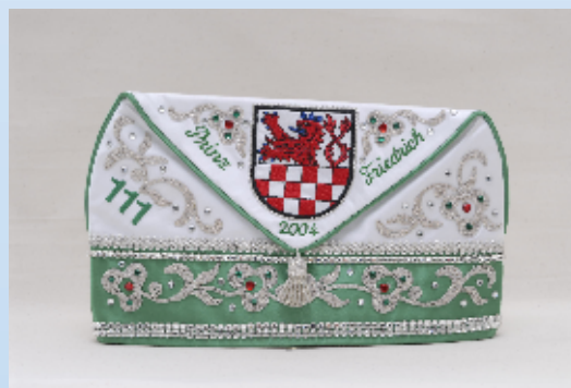
Wappen, Steine und Namen